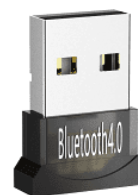
Clé USB Bluetooth