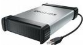
Disque dur externe