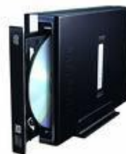
Graveur DVD externe