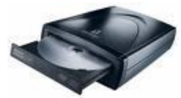
Lecteur DVD externe