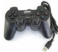
Manette de jeux